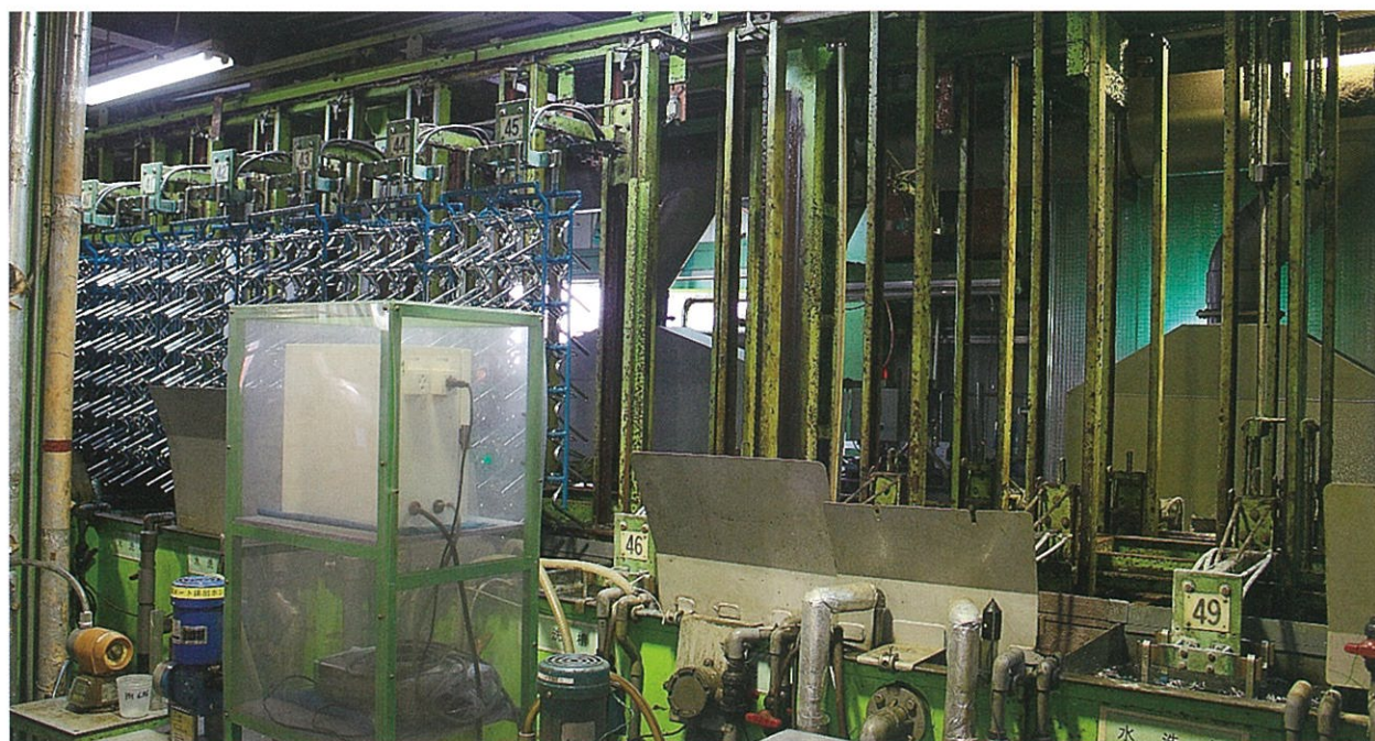
超音波とマイクロバブルの洗浄システム

めっき工程では、素材表面の油脂の付着や溶接焼け(スケール)の洗浄工程が重視されるが、従来の方法では不良率が高かった。そこで、マイクロバブルと超音波制御技術を用いた新たな洗浄装置の導入により、洗浄能力の向上と品質向上を図る。