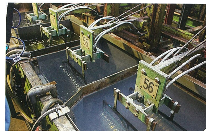
洗浄槽により、音波の制御を行う